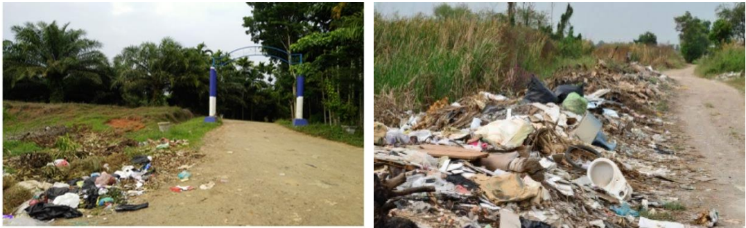
Gambar 4. Kondisi jalan masuk menuju TPA.

Bau busuk yang dikeluarkan oleh gas metana ( \text{CH}_4 ), karbon dioksida ( \text{CO}_2 ) dan senyawa lainnya, berasal dari sampah organik padat. Gas tersebut merupakan gas rumah kaca yang dapat menurunkan kualitas udara di wilayah di sekitar TPA dan bau busuknya dapat mengganggu pernapasan manusia (Wibisono dan Dewi 2014). Kondisi jalan masuk menuju TPA yang dipenuhi dengan sampah di sepanjang pinggir jalan disajikan pada Gambar 4 .