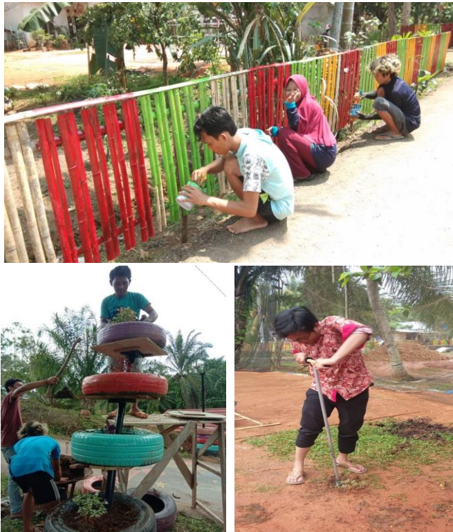
Gambar 5. Bentuk peran serta masyarakat dalam mengelola dan menangani sampah di perkampungan sekitar TPA Air Sebakul.

Keterlibatan masyarakat dalam menangani atau memproses sampah diantaranya seperti ikut dalam kegiatan kebersihan, rutin membayar pajak dan sumbangan persampahan di kelurahan masing-masing, bergotong royong dalam membersihkan fasilitas permukiman sekitar dan menyediakan tempat sampah di setiap halaman rumah (Artiningsih 2008). Bentuk peran serta masyarakat dalam mengelola sampah dan membangun desa ditunjukkan pada Gambar 5 .