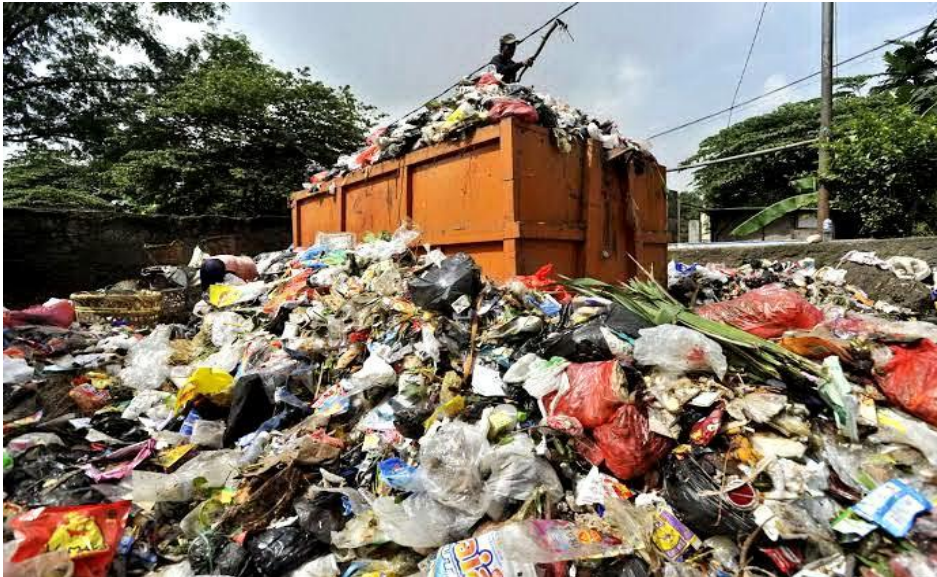
Gambar 3. Timbunan sampah bagi masyarakat sekitar TPA.

Kondisi TPA Air Sebakul saat ini dalam keadaan yang sangat tidak layak dipakai, sebab sudah terlalu penuh dengan sampah yang setiap harinya masuk berkisar 300 m 2 . Pada saat musim hujan, truk sampah pun mengalami kesulitan untuk masuk ke blok-blok pemrosesan sampah. Perlu dilakukan penyemprotan secara berkala untuk mengatasi banyaknya lalat akibat bau busuk dari timbunan sampah. Pengelolaan sampah di TPA Air Sebakul ini sudah lebih dari 19 tahun dilakukan dengan sistem open dumping (Wijaya et al. 2013). Gambaran timbunan sampah di TPA Air Sebakul ditampilkan pada Gambar 3 .