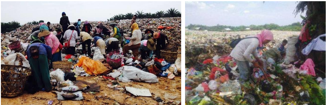
Gambar 2. Mata pencaharian masyarakat sekitar TPA.

Faktor perekonomian masyarakat di sekitar TPA semakin meningkat dan membaik, serta pengangguran berkurang. Hal ini karena masyarakat sekitar mendapat mata pencaharian baru sebagai peternak, pengepul dan pemulung (Albana 2016). Gambaran mata pencaharian masyarakat di sekitar TPA ditampilkan melalui Gambar 2 .