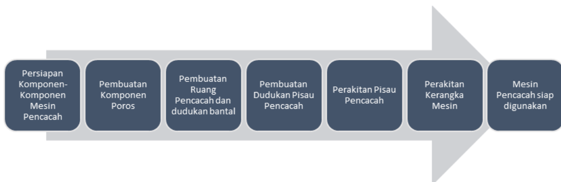
Gambar 3. Proses pembuatan mesin pencacah.