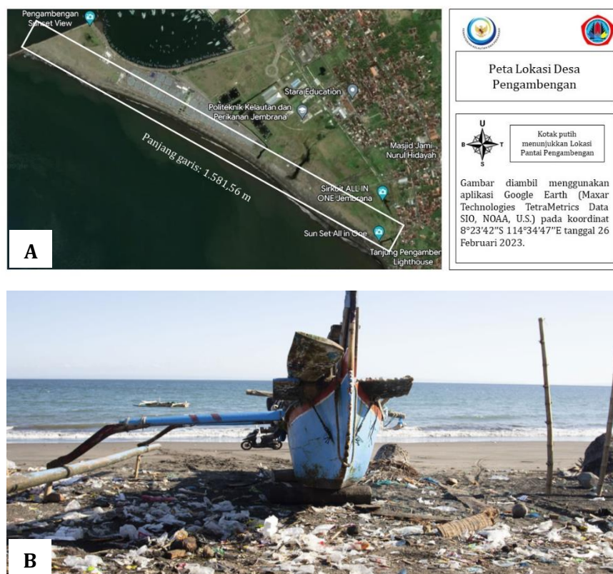
Gambar 1. Lokasi pelaksanaan penelitian di (A) Desa Pengambengan dan (B) Pantai Kabupaten Jembrana, Bali (STOP 2019).

Pengambilan sampel sampah plastik dilaksanakan di pantai yang terdapat di Desa Pengambengan, Kabupaten Jembrana, Bali ( Gambar 1 ). Sampah plastik yang diperoleh kemudian dibawa ke Teaching Factory Pengolahan Hasil Laut untuk dilakukan analisa lanjutan. Pembuatan mesin "SHARK" dilakukan di Teaching Factory Pengolahan Hasil Laut, Politeknik KP Jembrana, Bali.