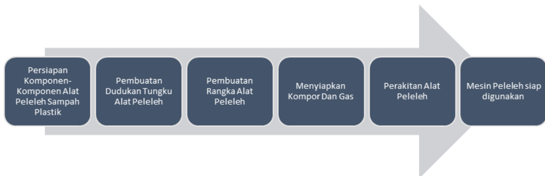
Gambar 5. Proses pembuatan mesin peleleh.