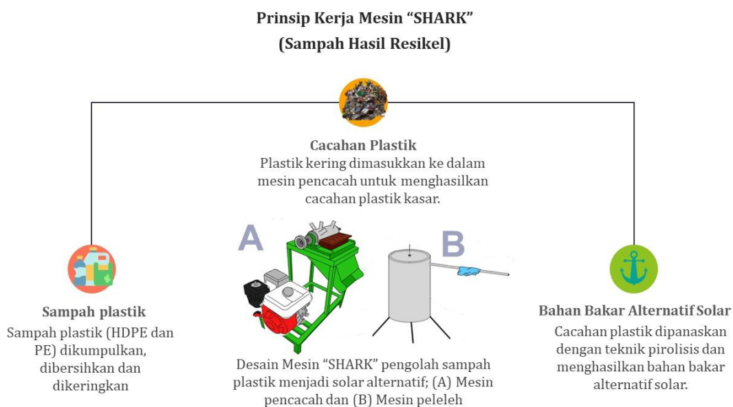
Gambar 6. Alur penggunaan mesin "SHARK".

Prinsip kerja mesin pencacah yaitu menggerakkan pisau putar menggunakan dinamo motor, kemudian daya dari mesin ini ditransmisikan menggunakan puli dan sabuk ( Gambar 6 ). Fungsi puli untuk mereduksi putaran mesin sesuai dengan kebutuhan. Selanjutnya, sampah plastik yang sudah dibersihkan dan dipisahkan berdasarkan jenisnya dimasukkan ke dalam mesin melalui corong masuk. Cacahan plastik kemudian keluar melalui saringan bawah dan corong keluar. Cacahan plastik ini mempercepat proses pembakaran karena lebih mudah terbakar secara sempurna pada mesin peleleh sampah plastik.