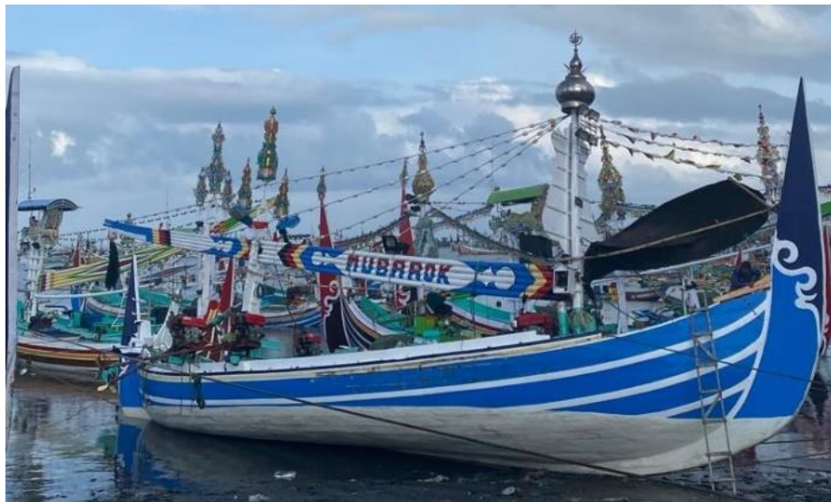
Gambar 7. Kapal tradisional Slerek di Desa Pengambangan.